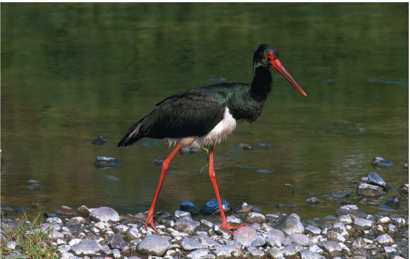
Cigüeña Negra ( Ciconia nigra ).

Especies principales, con sus poblaciones y criterios de importancia.