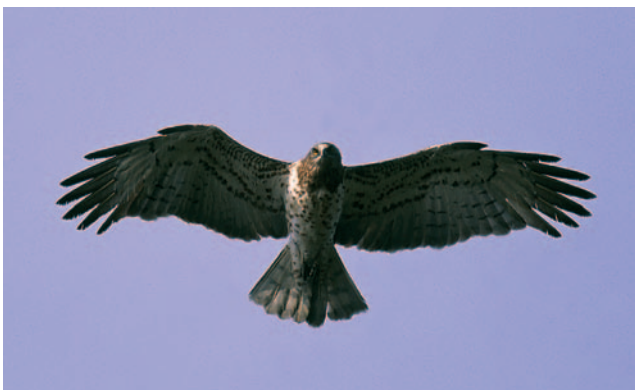
Águila Culebrera ( Circaetus gallicus ).

El Alimoche se ha extinguido recientemente como reproductor, aunque todavía de forma