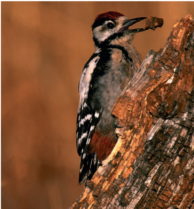
Pico Picapinos ( Dendrocopos major ).

Cigüeña Negra: La especie tiene en este enclave un importante área de cría (entre tres y cinco parejas nidificantes en 1998) parcialmente compartida con la provincia de Madrid, cuya principal área de alimentación se sitúa en la ZEPA de Campo Azálvaro, próxima a su límite norte. La población reproductora tiene importancia a nivel nacional e internacional, así como interés a nivel regional.